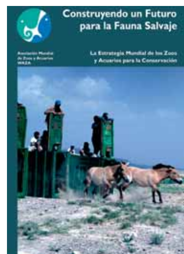
La Estrategia Mundial de los Zoológicos y Acuarios para la Conservación constituye un importante documento elaborado por la Asociación Mundial de Zoológicos y Acuarios (WAZA) que ofrece una visión integral de la función de los parques zoológicos en la conservación.

acceder a esta información estableciendo relaciones con Grupos de Expertos de la IUCN. A su vez, la comunidad de zoos puede ayudar a los Grupos de Expertos a establecer contacto con organizaciones y personas importantes en países y regiones donde no tienen representación. El Grupo de Expertos de cría para la conservación (CBSG) tiene como objetivo "conservar y establecer poblaciones de especies amenazadas a través de programas de cría para la conservación y mediante una protección intensiva y un manejo de dichas poblaciones de plantas y animales en la naturaleza". Para ello cuenta con grupos especializados que elaboran procesos científicos sistematizados que vinculan conservación in situ y ex situ, así como a personas que posean experiencia científica y capacidad catalizadora y de coordinación. Otros grupos de expertos, especialmente el grupo de Expertos en reintroducción, cada vez encuentran más oportunidades de vincularse a los zoos.