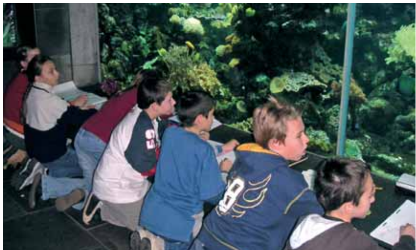
Para los jóvenes de muchas ciudades del mundo, los zos y acuarios son a menudo el primer contacto con la naturaleza y por tanto funcionan como incubadoras de futuros conservacionistas" Palabras del prólogo de Achim Steiner, Director General de la IUCN, a la Estrategia Mundial de conservación en los zoológicos y acuarios. Imagen tomada de la presentación del Dr. Gunther Nogge (de la Asociación Europea de Zos y Acuarios) durante la Semana Verde de la Comisión Europea, en mayo 2006.

La eficacia de las normas tiene mucho que ver con el mayor o menor consenso de la sociedad sobre la oportunidad y los beneficios que reportan. El compromiso de los agentes implicados, la colaboración de todos los interesados y la participación de toda la sociedad es la mayor garantía para lograr los objetivos propuestos. Estas consideraciones son especialmente