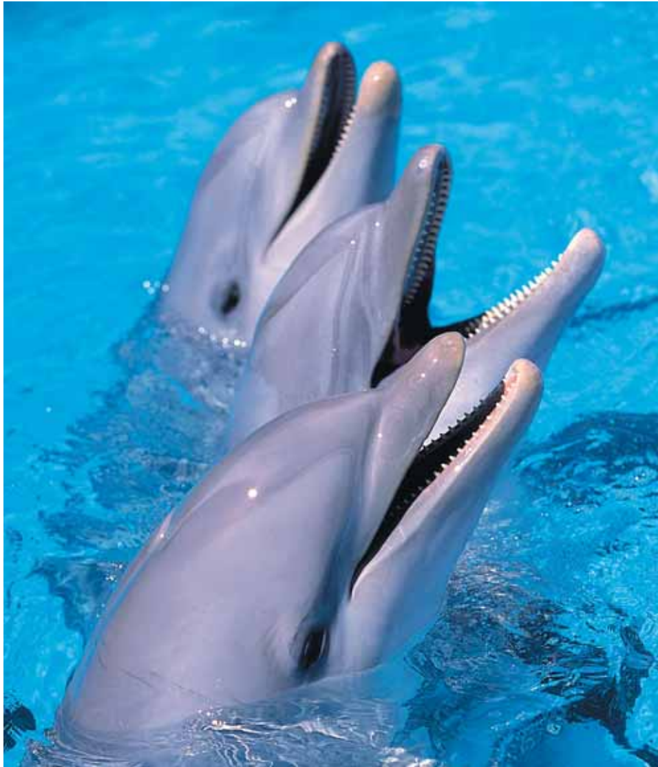
Delfines en el Zoo Aquarium de Madrid. De acuerdo con el artículo 3 de la Ley 31/2003 de conservación de la fauna silvestre en los parques zoológicos, se debe alojar a los animales en condiciones que permitan la satisfacción de sus necesidades biológicas y de conservación.

Un moderno parque zoológico adecuado a la nueva normativa debe convertirse en un escenario donde se transmita al público el valor de la diversidad biológica, la fauna y flora silvestre, los ecosistemas y la interdependencia de todos los organismos vivos de la tierra, incluyendo la especie humana