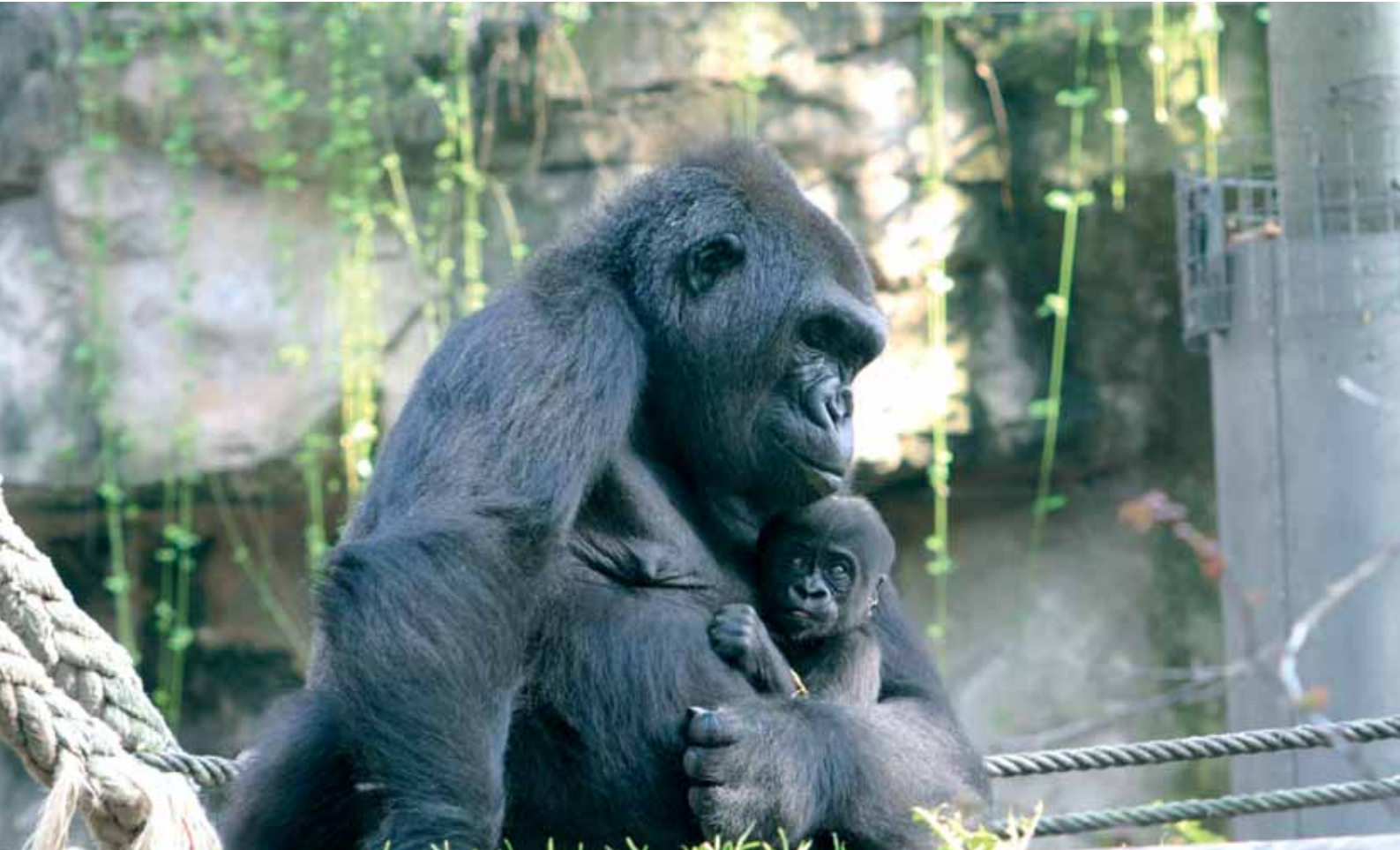
Cría en cautividad de gorilas en el Zoo de Barcelona. Este verano nacieron dos gorilas en el Zoo de Barcelona, N'tua, hembra, y N'goro, macho, pertenecientes a la subespecie del gorila de costa occidental Gorilla gorilla gorilla. Los pequeños han sido criados en la instalación, sin separarse de sus madres, gracias a un elaborado programa de alimentación con biberón por sus cuidadores.