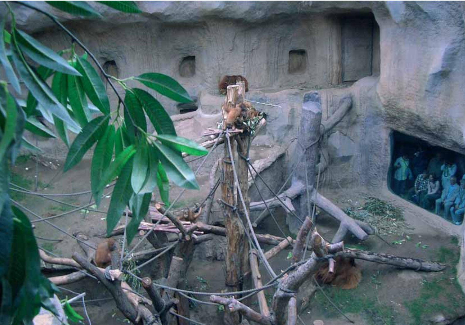
Alojamiento de orangutanes Zoo de Leipzig (Alemania). El mantenimiento adecuado del bienestar de los animales no es incompatible con el entretenimiento del público visitante, antes al contrario, aquél será indispensable para una correcta percepción por los visitantes de la necesidad de respetar y cuidar de los animales. Federico Guillén-Salazar.